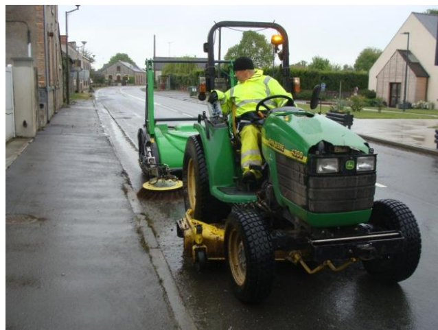
Nettoyage mécanique des caniveaux