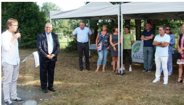
L'inauguration des 7 city stades de la CCN s'est faite le 28 août à la Grigonnais, en présence du sous-préfet

Ce nouvel équipement doit permettre des activités scolaires, périscolaires et extra-scolaires. Le prochain conseil va adopter un règlement intérieur. Son utilisation est placée sous la responsabilité du service municipal périscolaire.