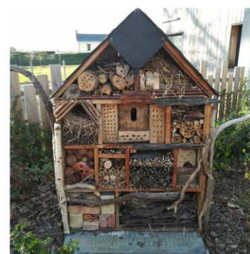
Un hôtel à insectes siège désormais devant le groupe scolaire La Hulotte.