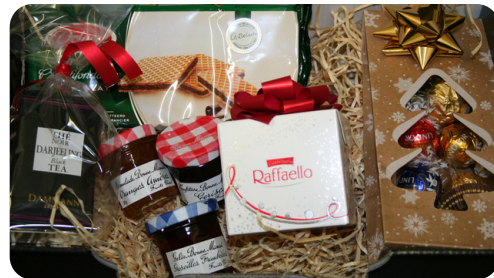
Colis des Aînés préparé par l'épicerie Aux Trois Fiefs qui a souhaité y participer financièrement

Le CCAS espère pouvoir organiser son prochain repas des Aînés au printemps 2022.