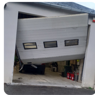
Un des portails vandalisés des services techniques de Treffieux

Ce même jour, d'autres ateliers municipaux de plusieurs communes du pays de Châteaubriant ont été visités par des cambrioleurs.